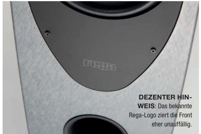
DEZENTER HINWEIS: Das bekannte Rega-Logo zierte die Front eher unauffällig.

Glasfaser als extrem leichtes, Zement hingegen als eher schweres Material. Wie genau Rega die Materialien für das Bandpassgehäuse anmischt, bleibt ihr Geheimnis, doch das Ergebnis stimmt.