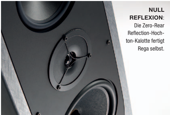
NULL REFLEXION: Die Zero-Rear Reflection-Hochton-Kalotte fertigt Rega selbst.