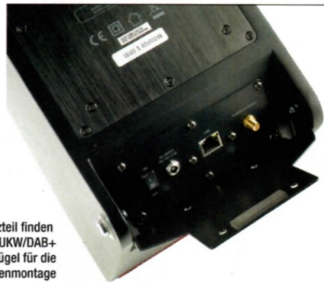
Neben einem Stromanschluss für ein Steckernetzteil finden sich Anschlüsse für ein LAN-Kabel und die UKW/DAB+ Antenne. Außerdem im Bild: der stabile Metallbügel für die optionale Wand- oder Deckenmontage